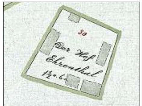
Ausschnitt aus Kartenblatt C mit Hof Ehrenthal vom Jahr 1706