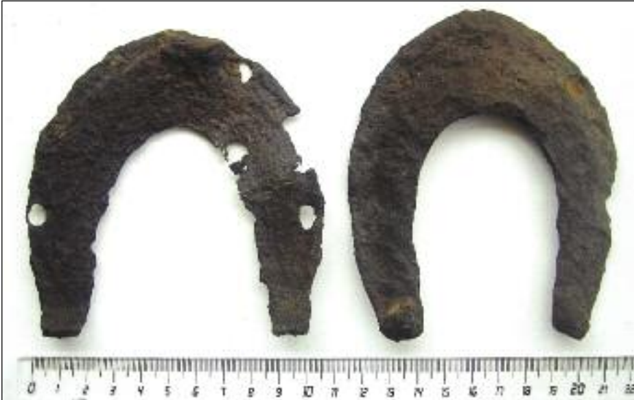
Hufeisen kleiner Kosakenpferde

verschiedentlich alte Scherben aus Keramik gefunden worden. Ebenso entdeckten