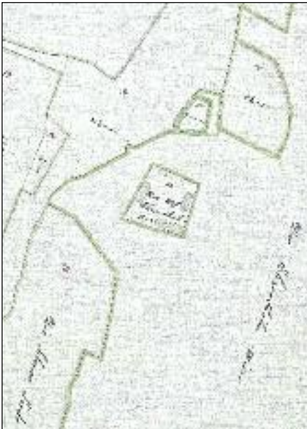
Hof Ehrenthal im Kartenblatt C aus dem Jahre 1706.