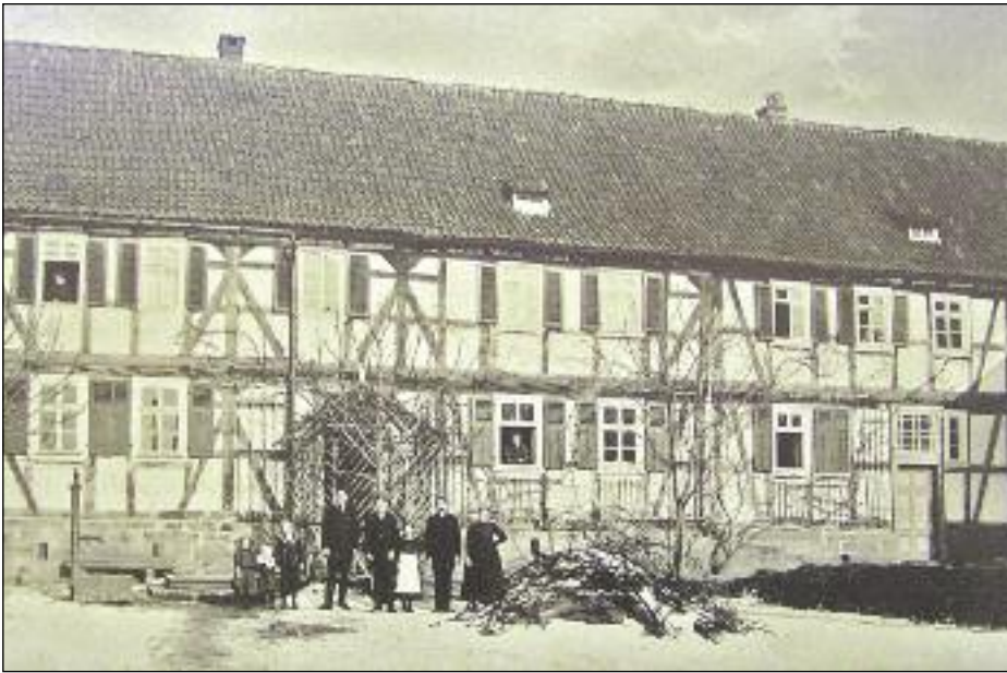
Wohnhaus „Wagnerscher Hof“, erbaut 1782, abgerissen 1966, Aufnahmezeitpunkt und Personen unbekannt.